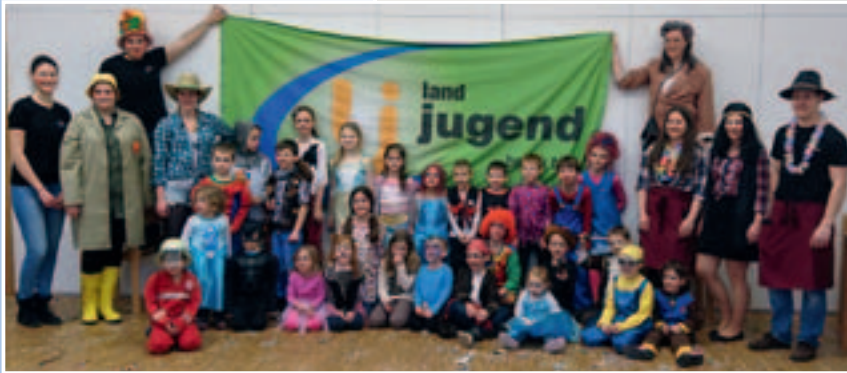
Kindermaskenball der Landjugend am 12. Februar 2017.