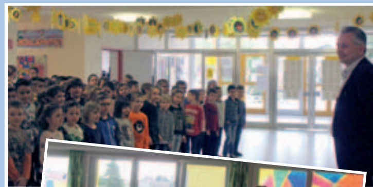
Die Freude bei Bgm. Leopold Figl war groß, als ihn die Kinder der Volksschule und der beiden Kindergärten mit Liedern und Gedichten anlässlich seines 50. Geburtstages überraschten.