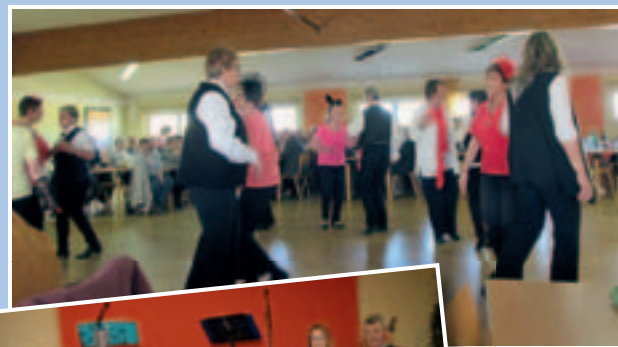
Seniorenfaschingskränzchen am 04. Februar 2017.