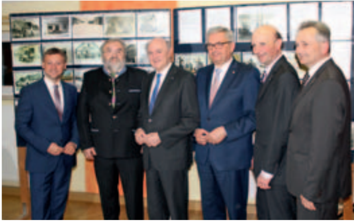
90 Jahre Markterhebung (Fotoausstellung von Aloys Steinhauser).