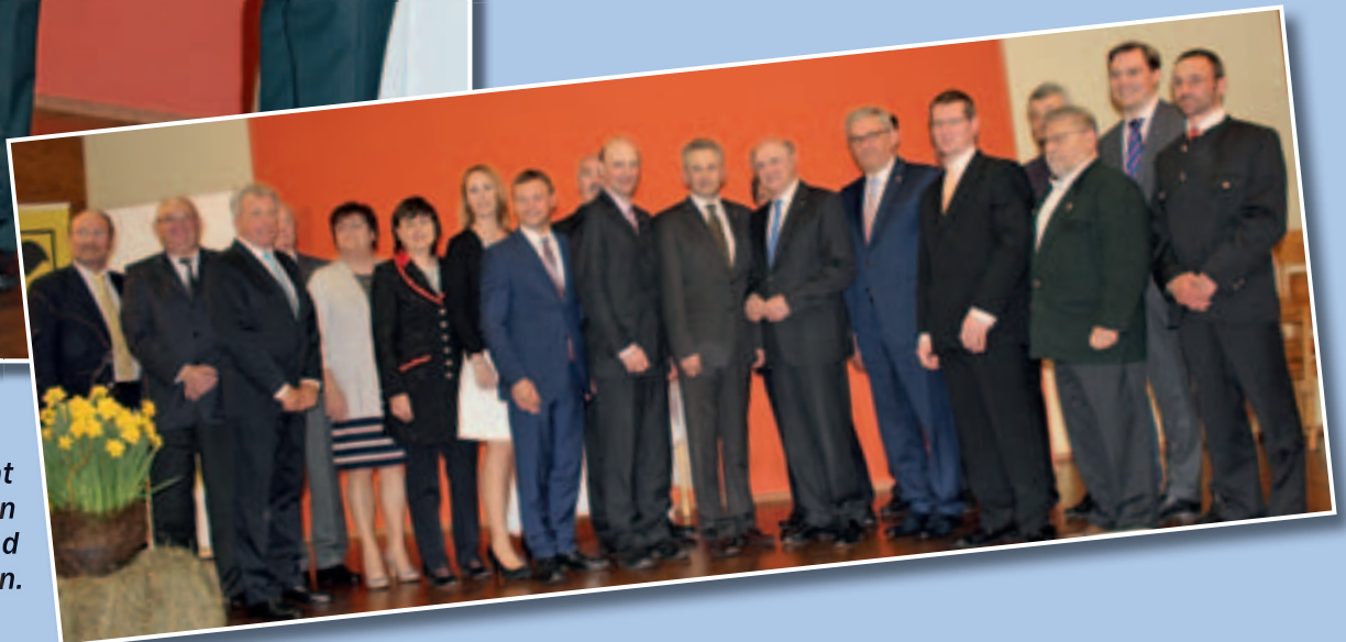
Der Gemeinderat mit LH Dr. Erwin Pröll und Ehrengästen.