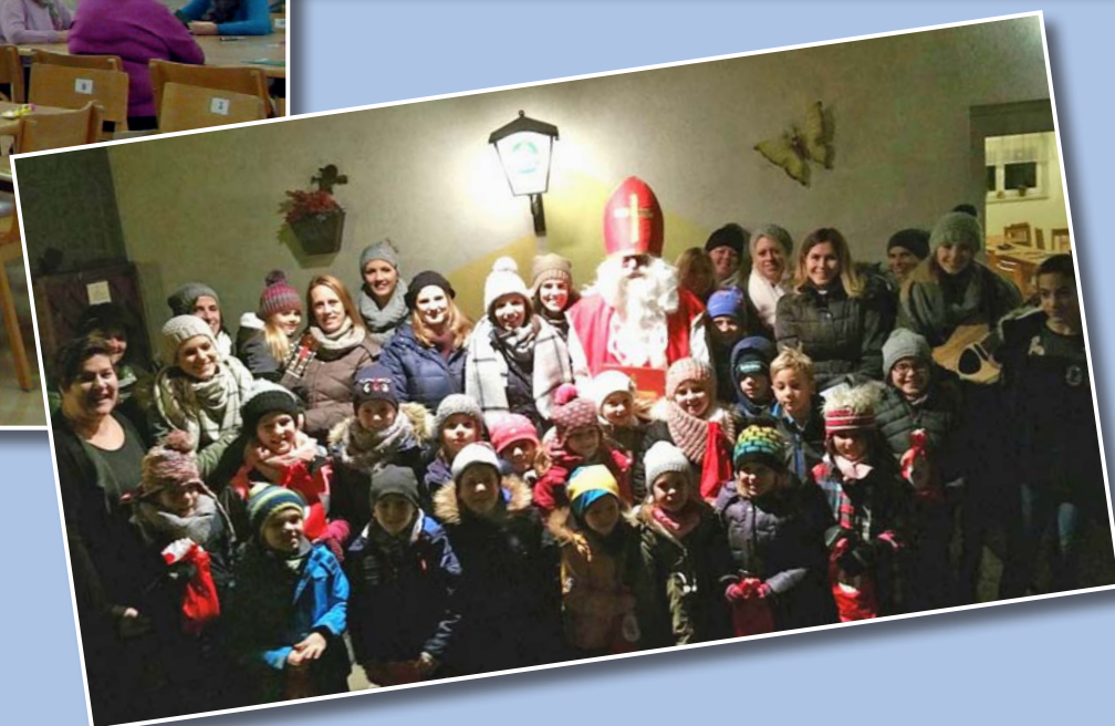
Adventfeier im Gasthaus Ehn am 2. Dezember 2017.