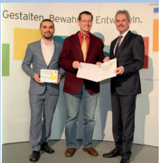
Auszeichnung zur Energiebuchhaltungs-Vorbild- gemeinde am 8. September 2017.