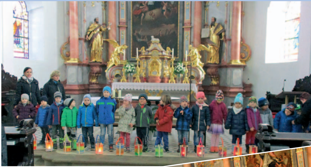
Laternenfest KG II am 9. November 2017.