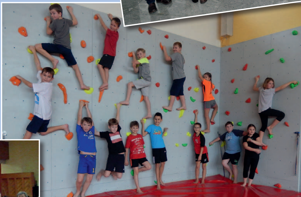
Die Kinder sind begeistert von der neuen Kletterwand im Turnsaal.