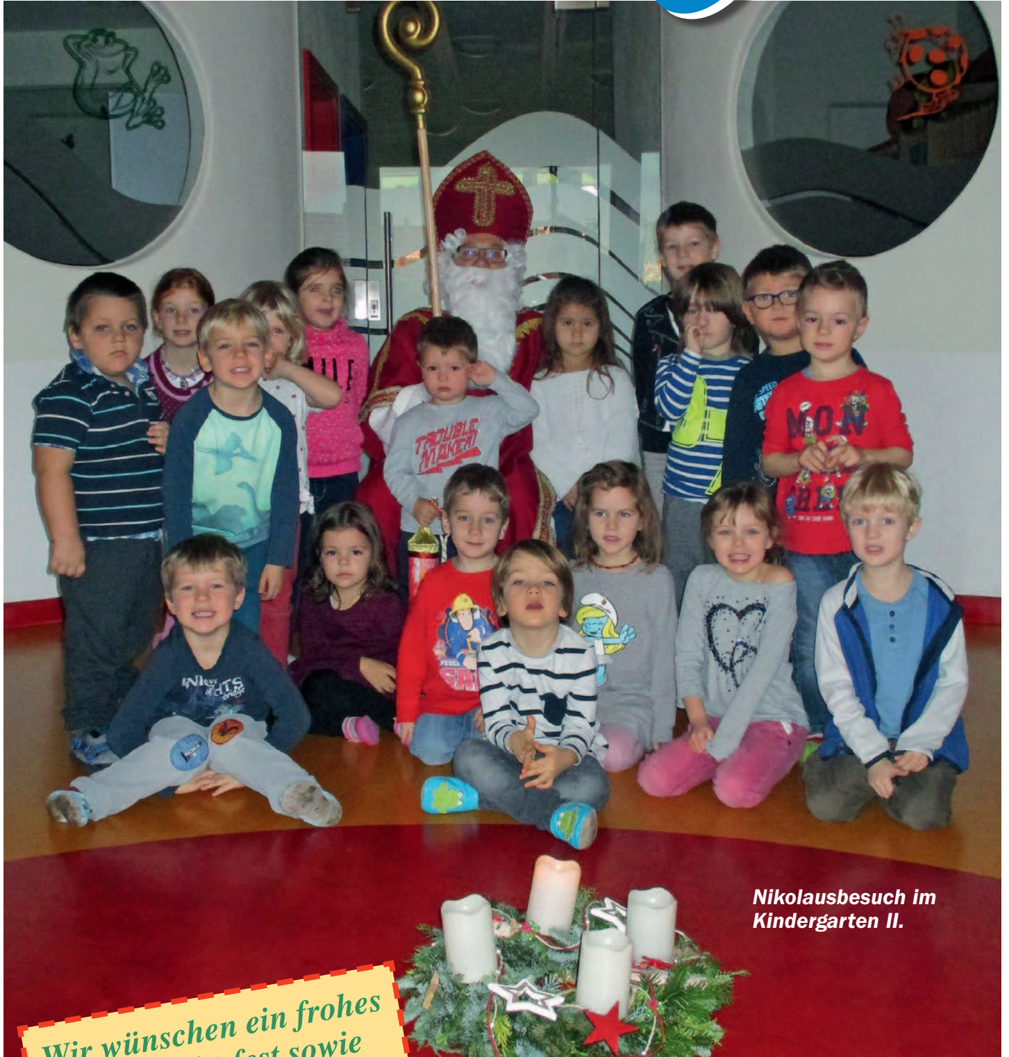
Nikolausbesuch im Kindergarten II.

MITTEILUNGEN DER MARKTGEMEINDE LANGENROHR