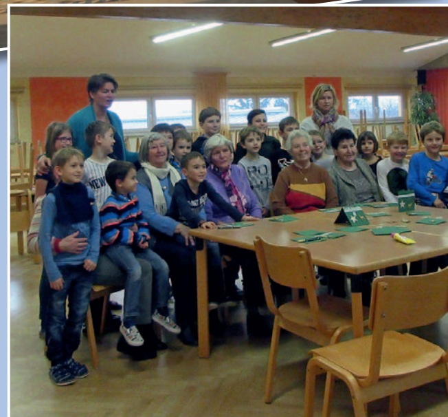
Basteln der Senioren mit den Hortkindern am 5. Dezember 2017.