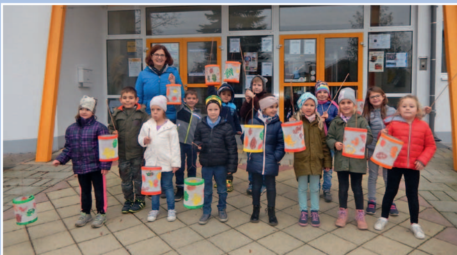
Volksschulkinder bei ihrer Laternenwanderung.