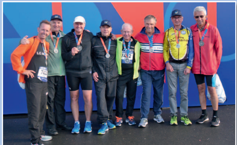
Das erfolgreiche Läufer-Team aus Asparn beim Moskau Marathon.