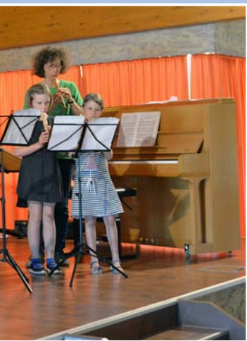
innen im Ensemble.