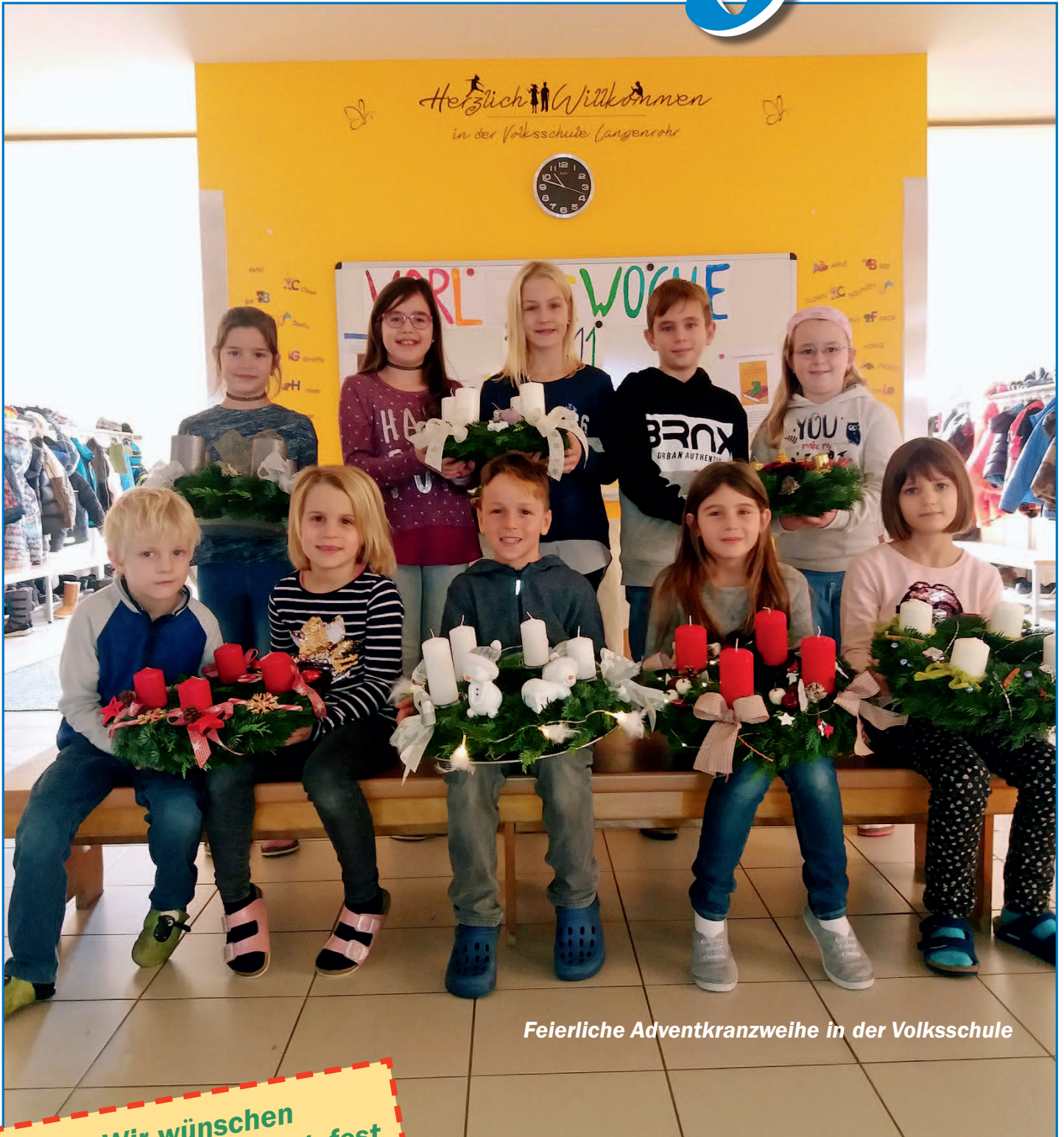
Feierliche Adventkranzweihe in der Volksschule

MITTEILUNGEN DER MARKTGEMEINDE LANGENROHR