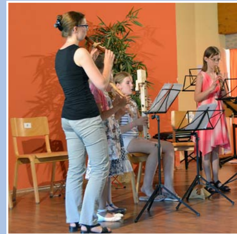
Mit Freude spielen die Musikschüler