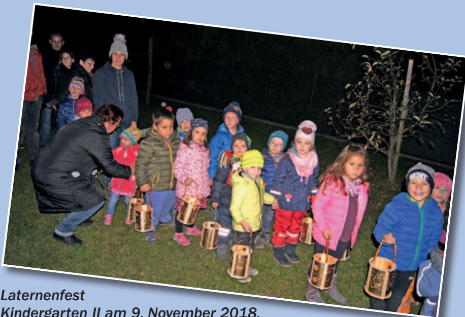
Laternenfest Kindergarten II am 9. November 2018.