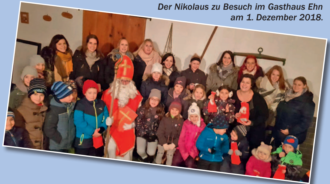
Der Nikolaus zu Besuch im Gasthaus Ehn am 1. Dezember 2018.