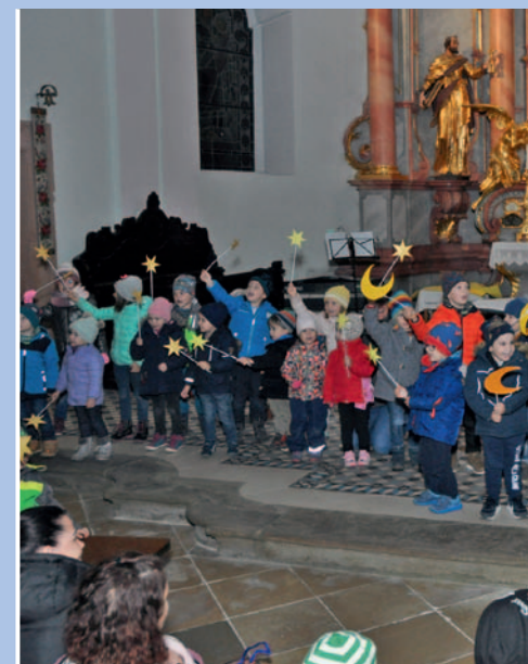
Laternenfest Kindergarten I am 13.